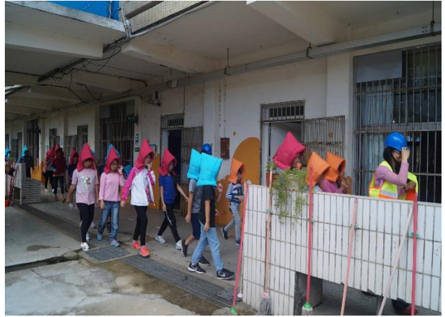
學生做到不語、不跑、不推前往集結區