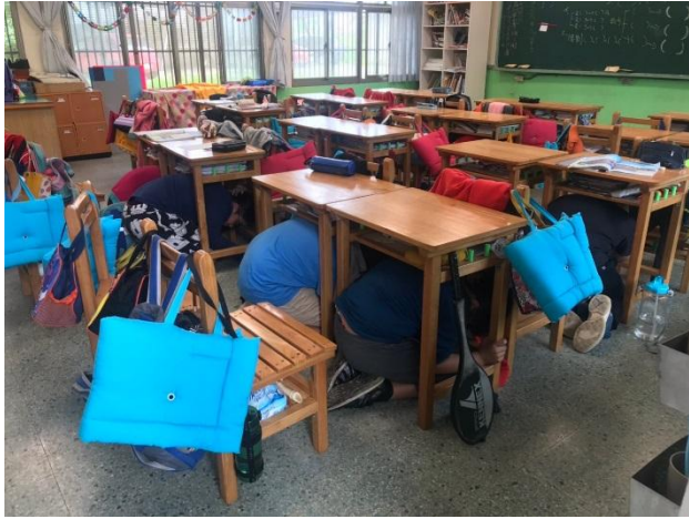
學生趴下、掩護、穩住保護頭頸部動作